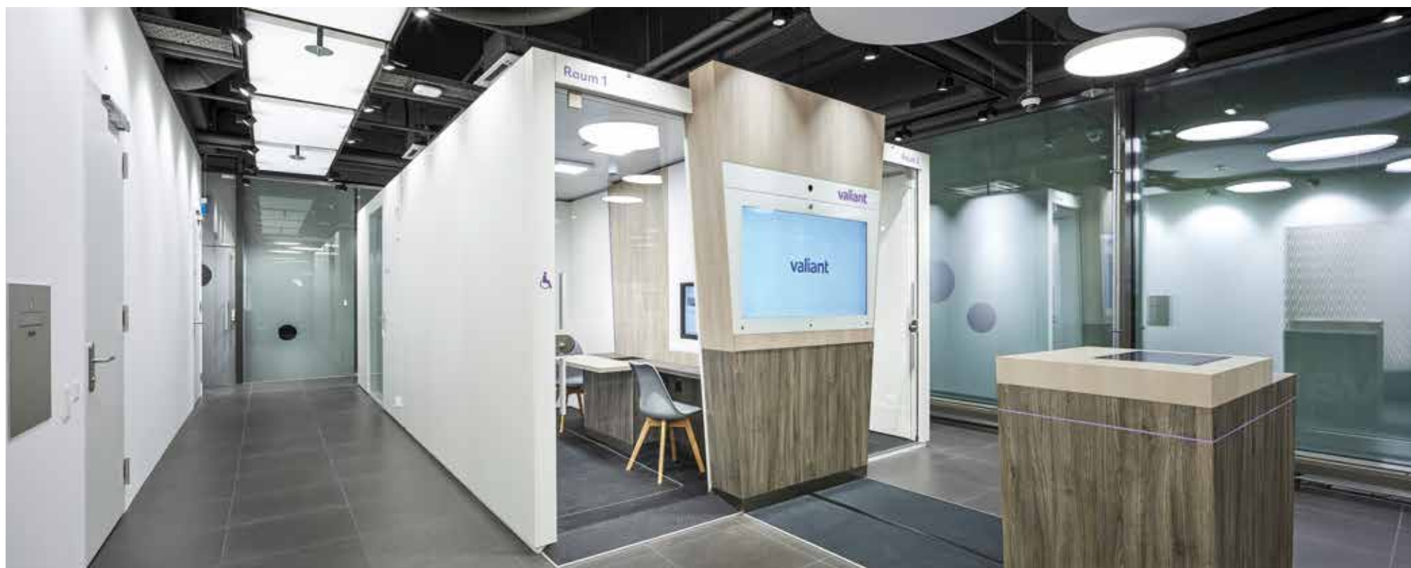
▲ Eine Raum-in-Raum Konzeption ermöglicht die Integration verschiedener Module

Lichtkonzepte LED Produkte LED Kompetenz