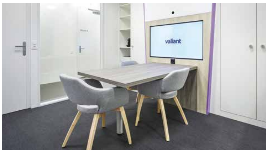
▲ Beratungsraum für persönliche Vorort-Termine