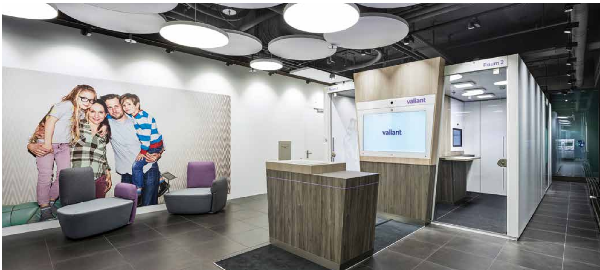
▲ Der neue Filialtyp besticht durch schlichte und zugleich moderne Einrichtung

Valiant ist in ihrem bestehenden Marktgebiet mit 84 Filialen stark lokal verankert – vor allem in ländlichen Gebieten. Künftig macht sie vermehrt den Schritt in die Wachstumszentren wie in Brugg. Zwei neue Standorte pro Jahr in bestehendem oder neuem Marktgebiet sind vorgesehen. Die neuen Geschäftsstellen geben Valiant auch dort ein Gesicht, wo man die Bank noch nicht kennt, wo man aber ihre digitalen Dienstleistungen wie die Online-Kontoeröffnung nutzt.