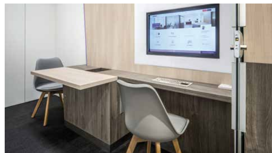
▲ Auch in der Selbstbedienung erhält man auf Wunsch Unterstützung per Video