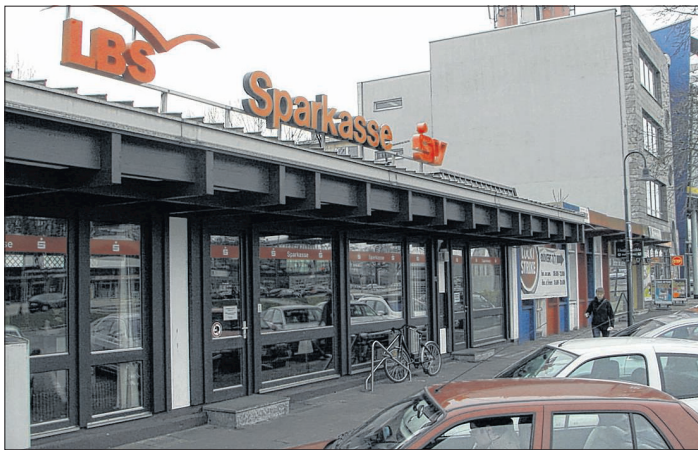
... wo früher dieser Flachdachbau stand – keine wirkliche Zier für den Kehler »Stadtboulevard«

Gemeinsam finanziert: Die Gesamtbaukosten belaufen sich auf rund 11 Millionen Euro. Finanziert wurde das Projekt durch ein gemeinsames Engagement der Sparkasse Hanauerland und ihrer elsässischen Partner-Organisation, der Caisse d'Epargne d'Alsace. Für ihre neuen Räume hat in der »Villa Europa« hat sie mit der Habitation Moderne einen langfristigen Mietvertrag abgeschlossen.