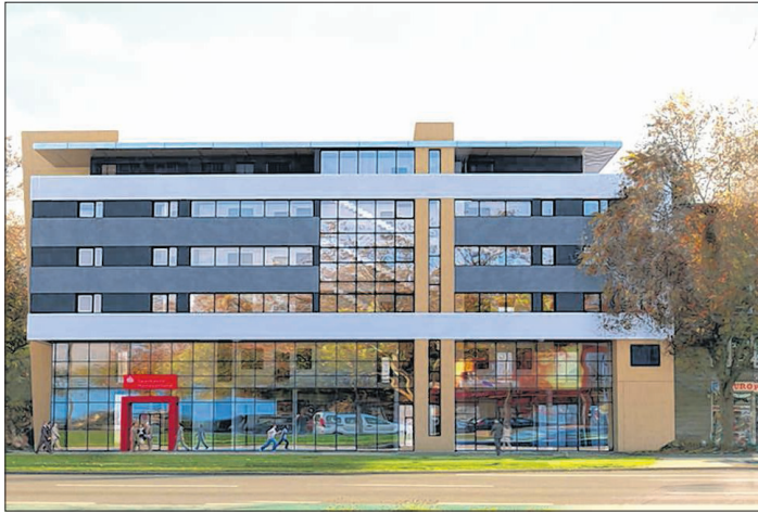
Die »Villa Europa« steht heute an jener Stelle...

Grafik: Architekturbüro Jürgen Großmann, Kehl