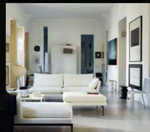
Suita Sofa Antonio Citterio, 2010