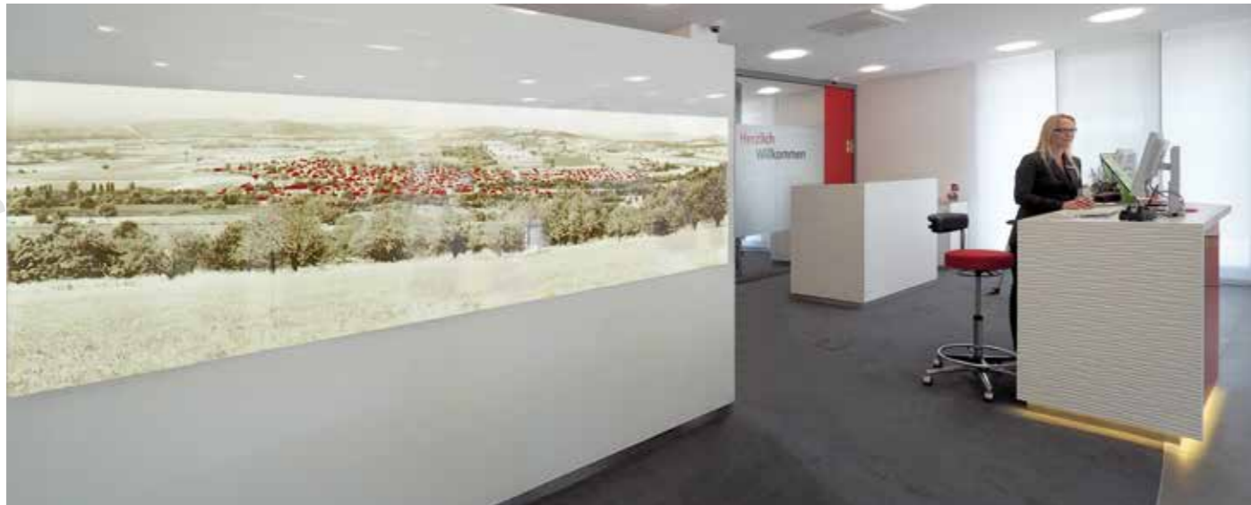
▲ Binzen aus der Vogelperspektive: hinterleuchtetes Glasbild für regionale Verbundenheit: alle Hausdächer sind sparkassenrot akzentuiert

Mittlerer Weg 1a 79424 Auggen Tel +49 7631 1817-0 info@ml-impuls95.de www.ml-impuls95.de