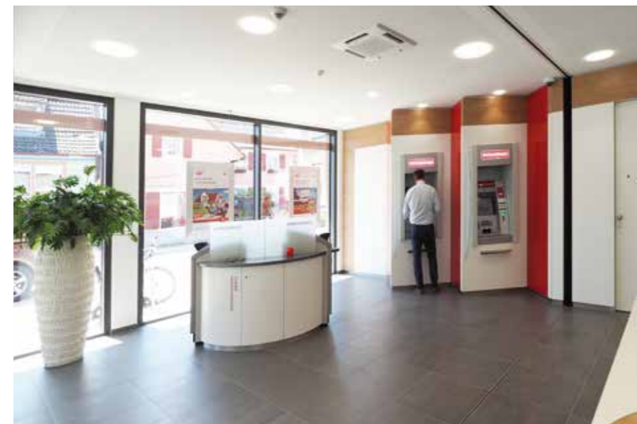
▲ Großzügiger 24 h Bereich - die klare Gestaltung der SB-Wand fügt sich harmonisch in das Gesamtinterieur ein

Große Aufmerksamkeit galt in der Planung einer ausgeklügelten Aufteilung der wichtigsten Bankfunktionen: Kunden können sich beim Betreten der Bankfiliale sofort orientieren und zurechtfinden. Über den akzentuierten Eingang in Sparkassenrot so-