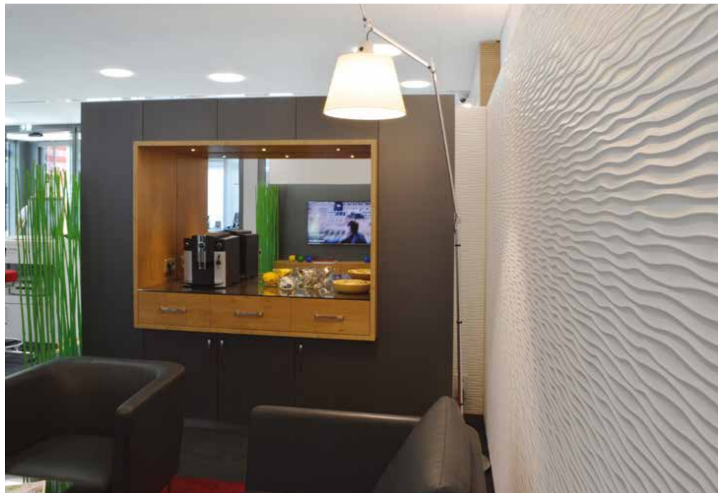
▲ Hoher Gestaltungsanspruch an den Loungebereich: Kunden sollen sich wohlfühlen

Planungsbüro für Banken Thomas Wunderle, Binzen