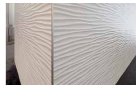
▲ Liebevoll, ausgewähltes Materialdesign

Die Philosophie der Sparkasse spiegelt sich am eingebauten Interieur wider. Die pfiffige Einrichtung mit Storecharakter sendet eine klare Botschaft: Nicht die Einrichtung soll am Point of Sale im Mittelpunkt stehen, sondern die dort arbeitenden Mitarbeiter. Eine gelungene Filialinszenierung, die nicht nur Neugierde weckt – sondern auch eine Wohlfühlatmosphäre vermittelt und den Besuch der Filiale mit all seinen menschlichen Komponenten und persönlicher Betreuung