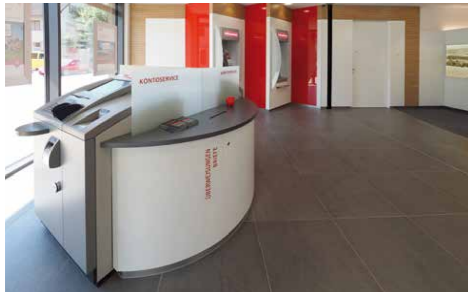
▲ Sichtverbindungen und Ausblicke zu allen SB Geräten in Reichweite zum Personal