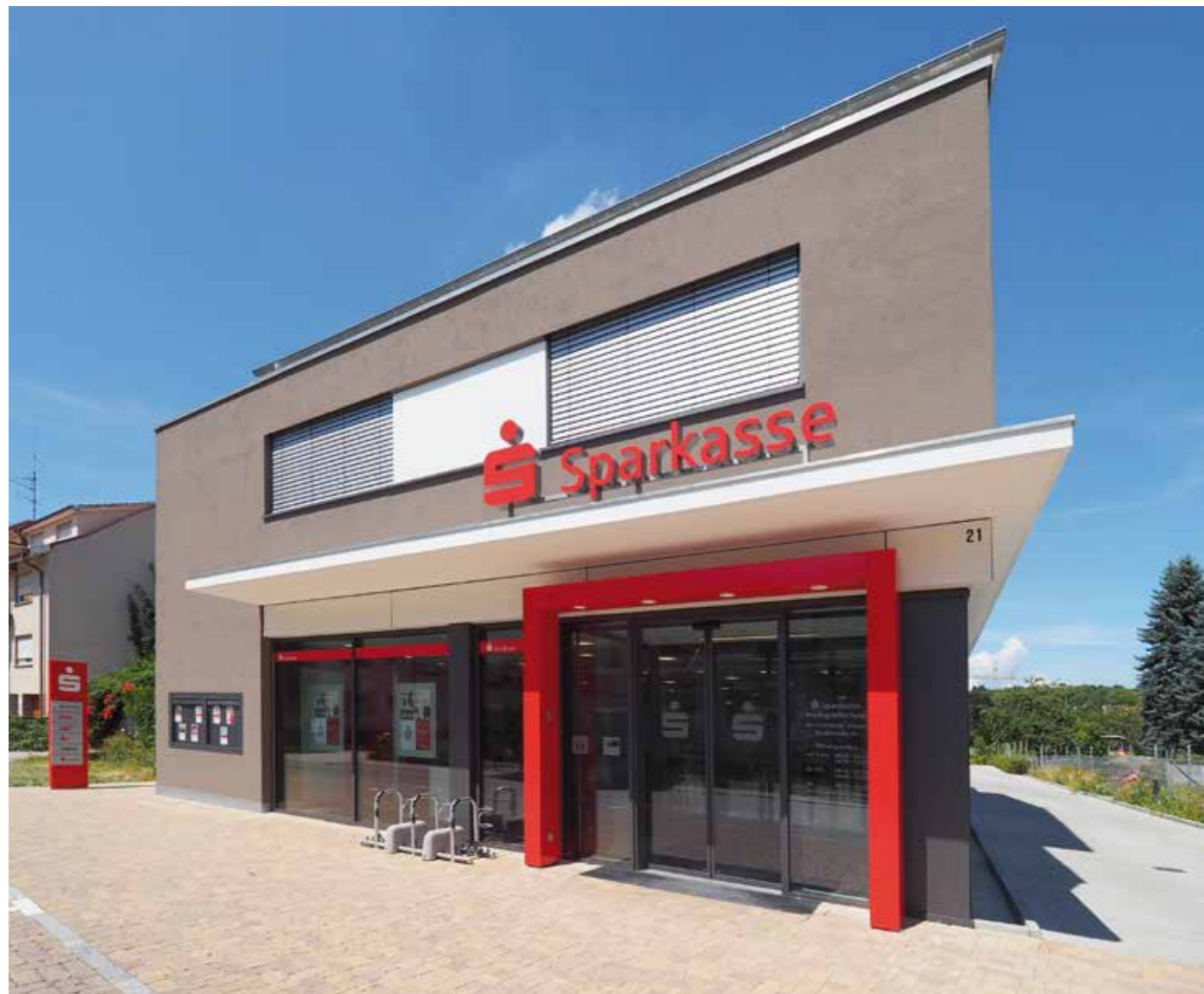
▲ Das neue Herz von Binzen: die markante und einladende Sparkasse, offen, freundlich und hell - ein echter Hingucker

Bankräume für Planung und Bauleitung die Ansage und das Motto „aus Kundensicht zu planen“. Es galt, Themen wie Sparkassen Corporate Identity, funktionale Abläufe, Regionalität sowie im Zuge der Digitalisierungsthemen „offline und online“ in der richtigen Dosis umzusetzen. Für die Erstellung des Gebäudes gab es einen örtlichen Investor. Die Sparkasse sicherte sich im Vorfeld das Erdgeschoss mit einem langfristigen Mietverhältnis und gleichzeitig ein Bekenntnis zu Binzen. Noch lange vor Baubeginn konnten somit in der Planung alle wichtigen Bausteine für ein modernes Sparkassen-Filialkonzept berücksichtigt werden.