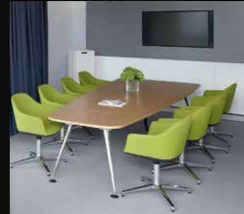
Softshell Chair Ronan & Erwan Bouroullec, 2008