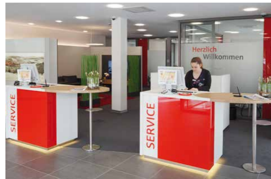
▲ An den Bedienelementen erfolgt die persönliche Beratung. Kunden haben tagsüber immer einen Ansprechpartner im Fokus.