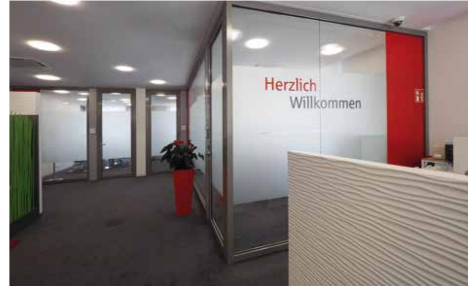
▲ Kundehalle mit Blick auf den diskreten Beratungsbereich

informieren oder ein abschließendes Kundengespräch bei einer Erfrischung weiter vertiefen. Die verwendeten Materialien und die Auswahl bequemer Sitzmöbel wurden auf alle Kunden- und Altersgruppen abgestimmt. Die Einrichtung und die Gestaltung wurde auf reduzierte Art und Weise insze-