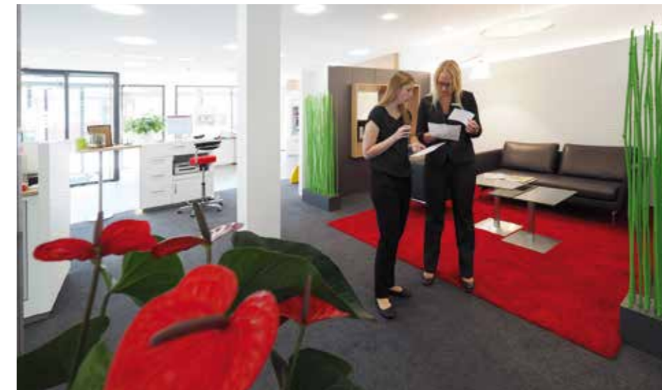
▲ Ein besonders herzlicher Empfang in einem außergewöhnlichen Sparkassen-Lounge-Ambiente und Caffeebar.

Mit einer schallhemmenden Gipskartonlochdecke sowie eingelassenen Kühlkassetten wurden Anforderungen an Schallschutz und Kühlung optimal gelöst, mit raumhohen schallabsorbierenden Trennwänden ein Höchstmaß an Akustik erzielt. Mit roten Glasfeldern und einer signifikanten Foliengestaltung wurde ein ansprechender und lichtdurchlässiger Sichtschutz geschaffen. Durch einen Teppichbelag mit guten Gehkomfort wird ein weiterer Beitrag an die angenehme Raumakustik geleistet. Da der Baukörper nicht unterkellert ist und auch die schöne Fassade rundum geschont werden sollte, wurden die Außeneinheiten der Kühlgeräte in einen mit Gittern versehenen, überfahrbaren Betonschacht im Parkaußen-