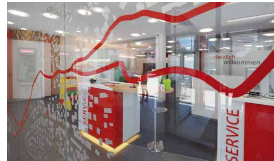
▲ Vom „Skizzenpapier“ zur Folie an die Mobilwand: einzigartige Glasgestaltung, der Binzener Ortsplan, ein echter Hingucker im Sparkassendesign