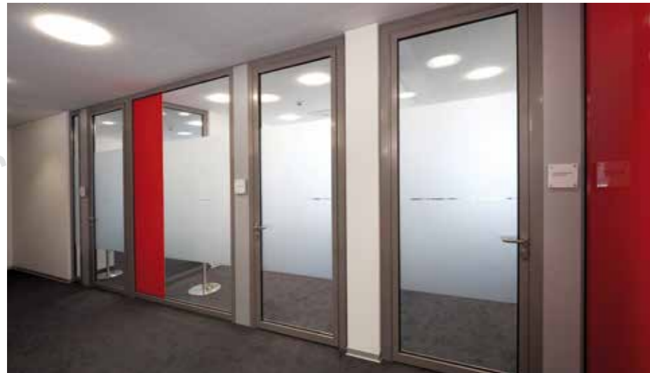
▲ Raumhohe, transluzent, gestaltete Glastrennwände mit rot lackierten Farbtupfern sorgen in der Kundenberatung für höchste akustische Ansprüche