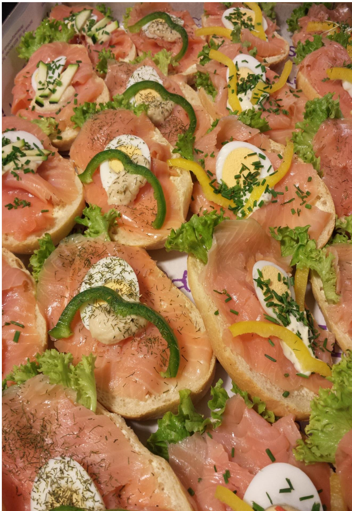
Belegte halbe Semmeln mit Lachs