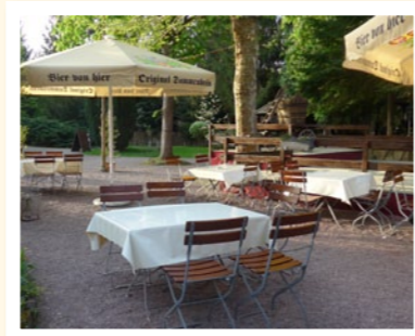
Biergarten "Alte Schmiede"