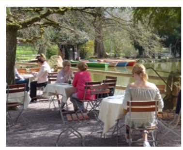
Biergarten „am See“