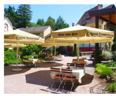
Biergarten „am Brauhaus“

knusprig gebratenes Hähnchen mit hausgemachtem Treber-Brot ..... 9,50 €