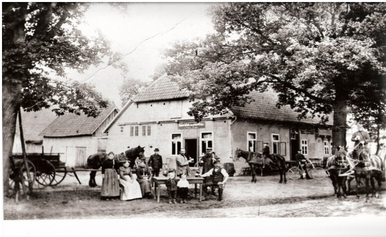
Der „ Mühlengrund „ vor über 100 Jahren