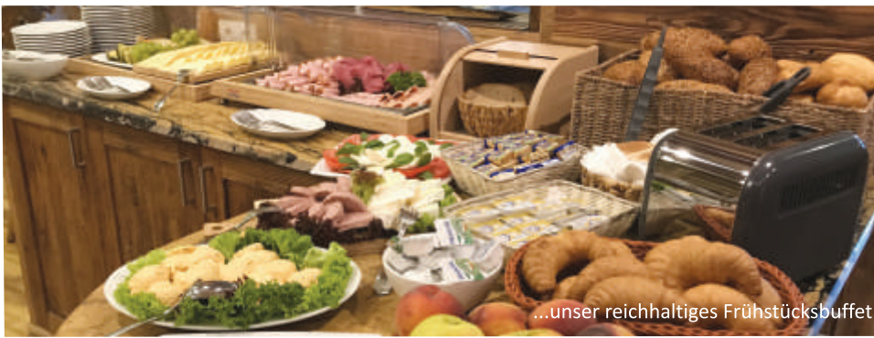
...unser reichhaltiges Frühstücksbuffet