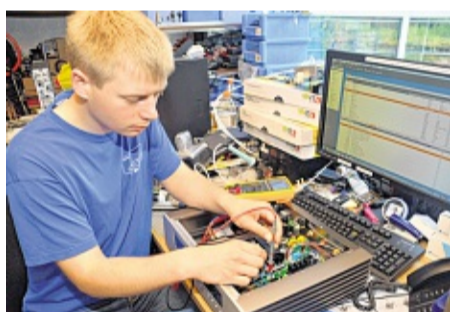
Die Sierck-Kunden profitieren von der kompetenten Werkstatt vor Ort in Quern.

STEINBERGKIRCHE-QUERN Wirtschaftliche Entwicklungsprozesse führen generell zu einer Angebotskonzentration in zentralen, meist größeren Orten. Fachgeschäfte und Handwerksbetriebe haben jedoch auch im ländlichen Raum stabile kaufmännische Chancen, vorausgesetzt, sie bieten ihren Kunden spezielle Produkte und Dienstleistungen sowie einen ausgezeichneten Service an. Ein gutes Beispiel dafür ist die Firma Fernseh Sierck in Quern, die in diesem Jahr ihr bemerkenswert 35-jähriges Bestehen begeht.