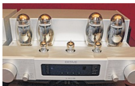
Octave Röhrengerät im High End-Bereich.

Zubehör für Drucker, Verbindungskabel aller Art,