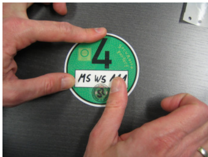
7. Andrücken der Klebefläche