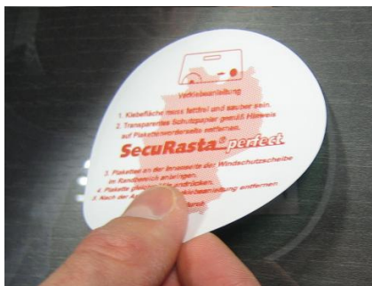
9. Anbringen auf der Windschutzscheibe