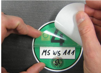
6. Öffnen der Klebefläche für das Versiegeln der Beschriftungsfläche