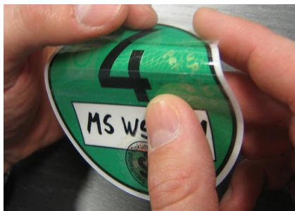
8. Abzug des Schutzpapiers durch leichtes Knicken der Feinstaubplakette zur Verklebung an der Windschutzscheibe