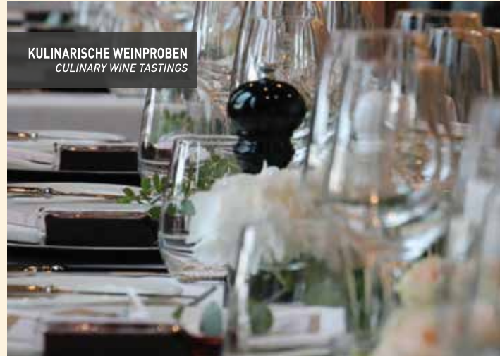
KULINARISCHE WEINPROBEN CULINARY WINE TASTINGS