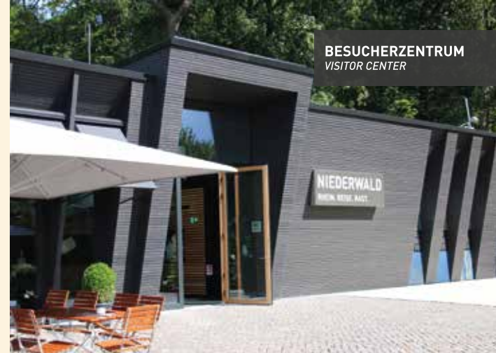
BESUCHERZENTRUM VISITOR CENTER