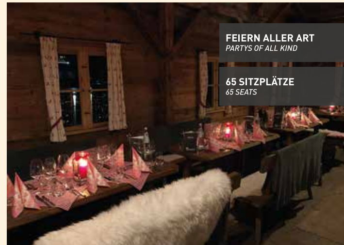
FEIERN ALLER ART PARTYS OF ALL KIND