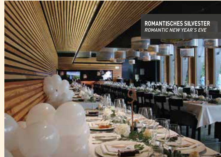
ROMANTISCHES SILVESTER ROMANTIC NEW YEAR'S EVE