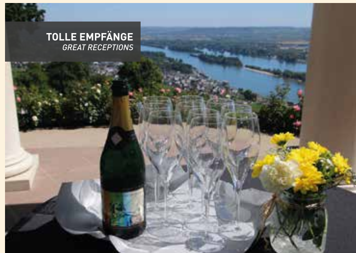
TOLLE EMPFÄNGE GREAT RECEPTIONS