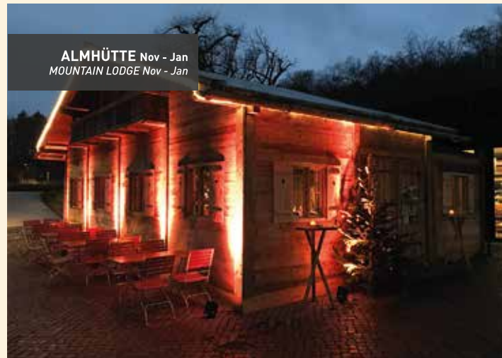
ALMHÜTTE Nov - Jan MOUNTAIN LODGE Nov - Jan