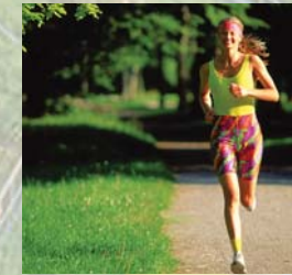
sowie Wander- oder Joggingmöglichkeiten in direkter Umgebung.

Unsere Pension befindet sich in ruhiger Lage, außerhalb des Zentrums, die Entfernung zum Stadtplatz beträgt ca. 2,5 km, das Kurviertel liegt etwa 4 km entfernt. Die Stadtbus-Haltestelle können Sie bequem zu Fuß erreichen.