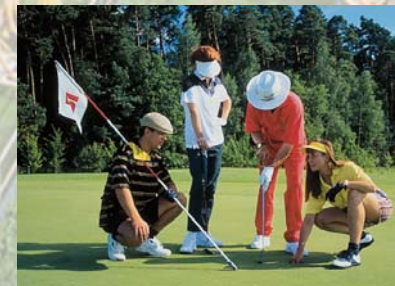
Ein Golfplatz liegt ca. 4 km von uns entfernt.

Unsere Pension befindet sich in ruhiger Lage, außerhalb des Zentrums, die Entfernung zum Stadtplatz beträgt ca. 2,5 km, das Kurviertel liegt etwa 4 km entfernt. Die Stadtbus-Haltestelle können Sie bequem zu Fuß erreichen.