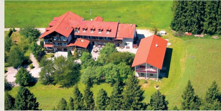
Die Waldpension verfügt über eine große Liegewiese