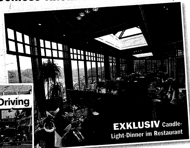
EXKLUSIV Candle-Light-Dinner im Restaurant

Unsere „Bedienung des Jahres“ und ihr Begleiter verbringen ein Wellness-Wochenende (Übernachtung im DZ) im Romantikhôtel Schloss Rheinfels in St. Goar. Im Wellness-Bereich des Hotels und bei einem Candle-Light-Dinner im exklusiven Restaurant darf sich unsere Gewinnerin von ihrem Job erholen. Der TRUCKER spendiert 300 Euro Taschengeld. Hotel-Infos: www.schlosshotel-rheinfels.de . Für die Zweit- und Drittplatzierte gibt's einen großen Blumenstrauß!