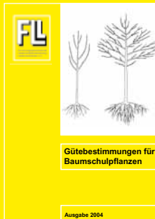
Gütebestimmungen für Baumschulpflanzen