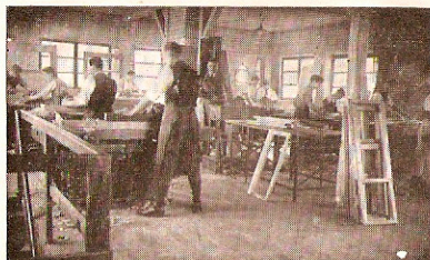
Raum zur Herstellung der Fenster