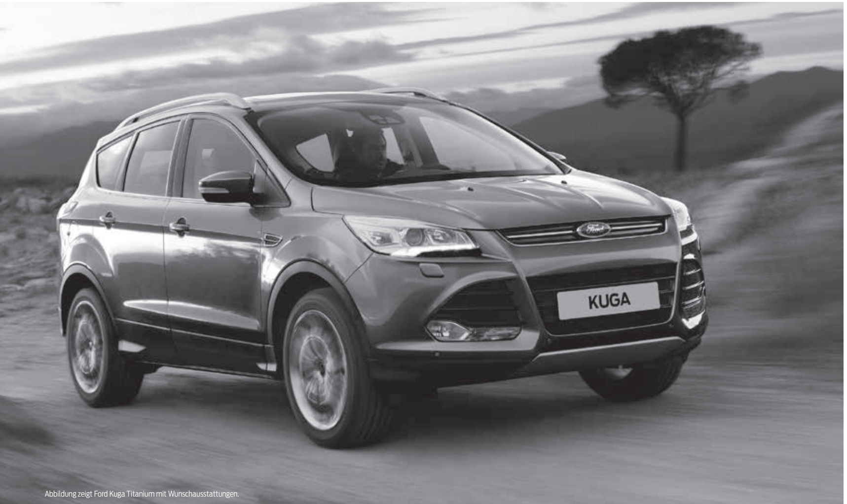
Abbildung zeigt Ford Kuga Titanium mit Wunschausstattungen.