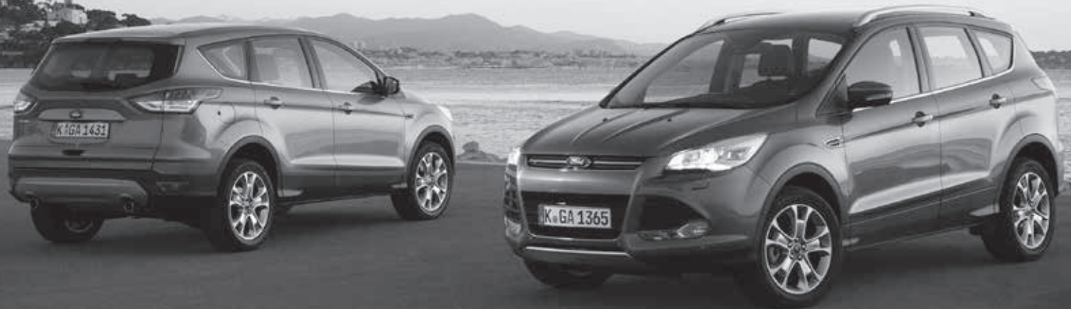
Abbildung zeigt Wunschausstattungen.