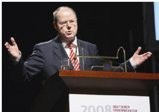
Bundesfinanzminister Peer Steinbrück hielt eine viel beachtete Rede.

Das Fachprogramm des Kongresses deckte ein breites Spektrum aktueller Themen aus Steuerrecht, Rechnungslegung und betriebswirtschaftlicher Beratung ab. Renommierete Experten berichteten praxisnah von neuesten Entwicklungen und diskutierten mit den Teilnehmern. Im „Forum junger Steuerberater“ standen Management-Themen im Vordergrund.