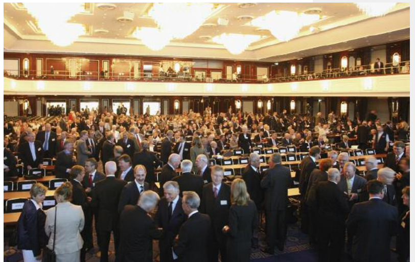
1.200 Teilnehmer besuchten den DEUTSCHEN STEUERBERATERKONGRESS in Berlin.