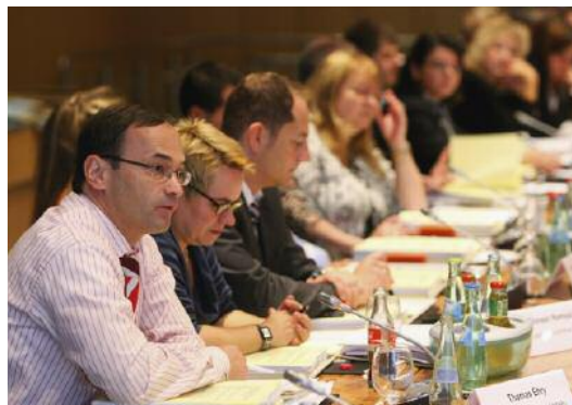
50 ehrenamtliche und hauptamtliche Ausbildungsexperten der Steuerberaterkammern diskutierten in Berlin Maßnahmen zur Nachwuchsgewinnung.

ders erfolgreiche Ansätze herausgearbeitet werden konnten. Diese Erfahrungen fließen auch in die neue Informationskampagne zum Ausbildungsberuf ein, mit der die Bundessteuerberaterkammer und die Steuerberaterkammern ab dem Jahr 2009 aktiv auf die