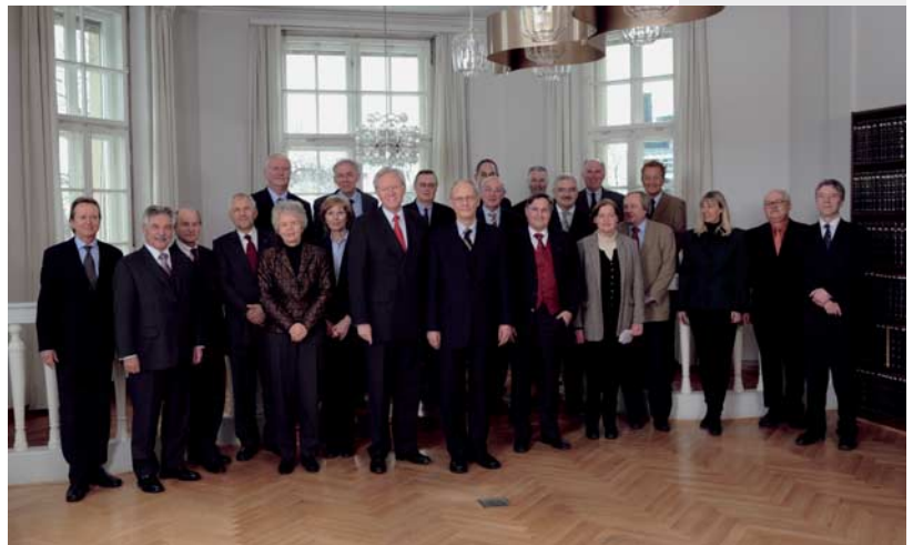
Das Präsidium der BStBK beim Münchener Spitzengespräch mit den BFH-Richterinnen und Richtern.

In der Frage der Zusammenlegung von öffentlich-rechtlichen Gerichtsbarkeiten vertraten beide Seiten eine einheitliche Position: Eine eigenständige und damit fachlich spezialisierte Finanzgerichtsbarkeit müsse erhalten bleiben. Die Qualität des Rechtsschutzes für die Steuerpflichtigen angesichts eines immer kom-