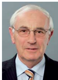
Helmut Messing Steuerberater/vereidigter Buchprüfer Präsident der Steuerberater- kammer Westfalen-Lippe