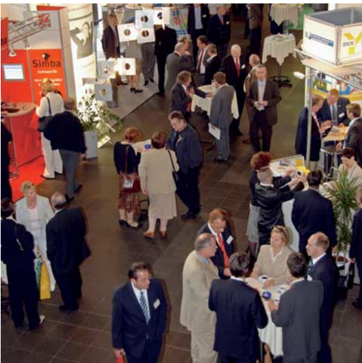
Fachausstellung auf dem DEUTSCHEN STEUERBERATERKONGRESS

cherungs- und Geldfragen, EDV und Bürokommunikation präsentierten. Viele Kongressgäste nutzen außerdem die Gelegenheit, Aachens Sehenswürdigkeiten zu besichtigen und Ausflüge in die reizvolle Umgebung zu unternehmen. Der musikalische und zugleich auch kulinarische Höhepunkt des Rahmenprogramms war der Galaabend im Krönungssaal des Aachener Rathauses. Preisgekrönte Sänger und Sternekoch Maurice de Boer verbanden in „Pasta Opera“ musikalische Kostbarkeiten unter anderem von Verdi, Rossini und Mozart mit einem italienischen Menü der Extraklasse.