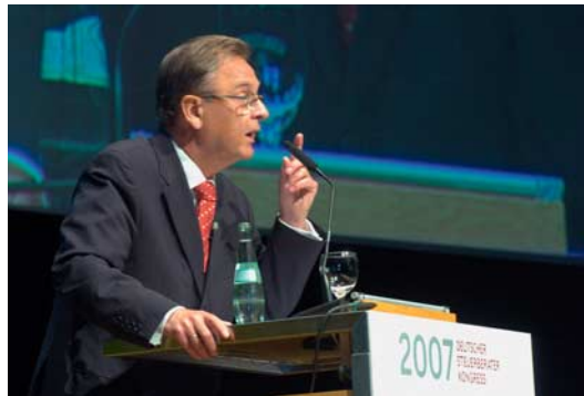
Der Präsident des Bundesverfassungsgerichts Professor Hans-Jürgen Papier übte Kritik am Zustand der deutschen Steuergesetzgebung.

beschlossene Fachberater-Qualifikation im Bereich der Vorbehaltsaufgaben.