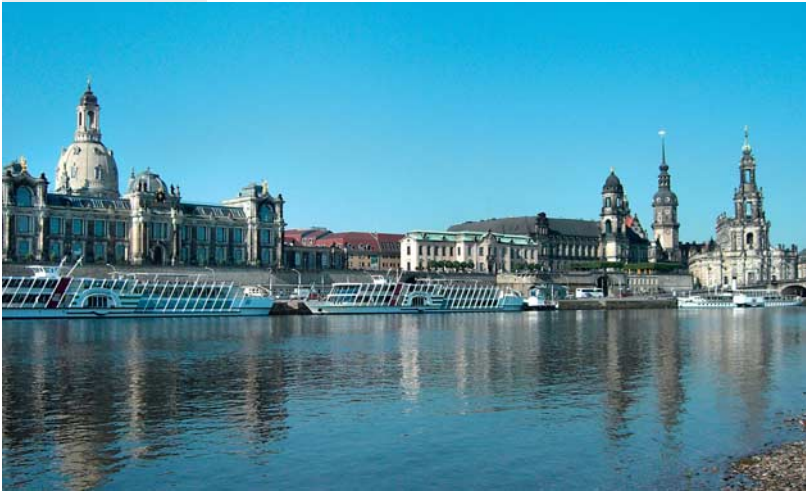
Dresden – malerische Kulisse für den DEUTSCHEN STEUERBERATERKONGRESS 2007