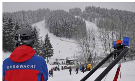
Einsatz im Skiliftkarussell Winterberg

Bei zahlreichen Großveranstaltungen wie Stadtfeste, Sportveranstaltungen, Karneval, Schützenfeste und anderen Veranstaltungen örtlicher Vereine leisten unsere Helfer/innen tausende von Sanitätsstunden – immer zur Stelle, wenn Hilfe benötigt wird. Während der Wintermonate ist das Winterrettungsteam im „Skiliftkarussell Winterberg“ und in der „Snow-World Züschen“ im Einsatz. Bei Großeinsätzen unterstützt der Kreisverband den Rettungsdienst.