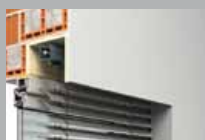
Aluminium-Raffstore Schiengeführtes Fassadensystem