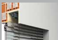
Aluminium-Raffstore Schiengeführtes Fassadensystem

ROMA bietet die ideale Beschattung für Privat- und Gewerbegebäude. Stets maßgefertigt aus hochwertigem Aluminium und mit serienmäßiger Motorbedienung.