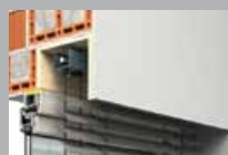
Aluminium-Raffstore Seilgeführtes Fassadensystem