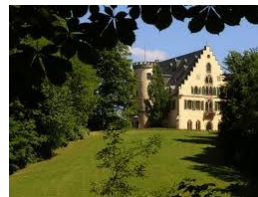
Rosenau in Rödentel