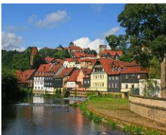
Kronach Festung Rosenberg und Altstadt