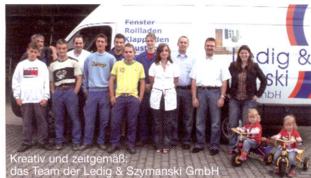
Kreativ und zeitgemäß: das Team der Ledig & Szymanski GmbH

Ledig & Szymanski GmbH · Breitenbacher Straße 20 66115 Saarbrücken · fon 0681-46413 fax 0681-48755 · info@ledig-szymanski.de · www.ledig-szymanski.de