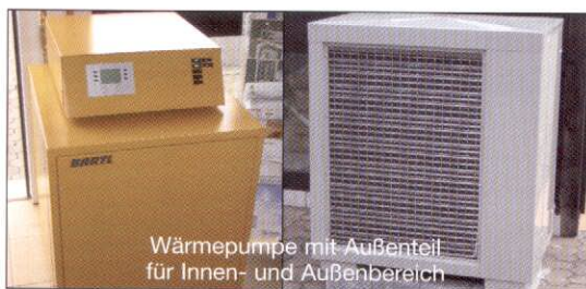
Wärmepumpe mit Außenteil für Innen- und Außenbereich

Sanitär - Heizung - Elektro - Rohrbruch - Abflussverstopfung - 24 Std. tägl., auch an Sonn- u. Feiertagen Tel. 0 68 94 / 3 41 33