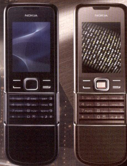
Nokia 8800 Arte