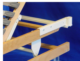
Typ2: Vorrichtung für integrierte Aufrichthilfe