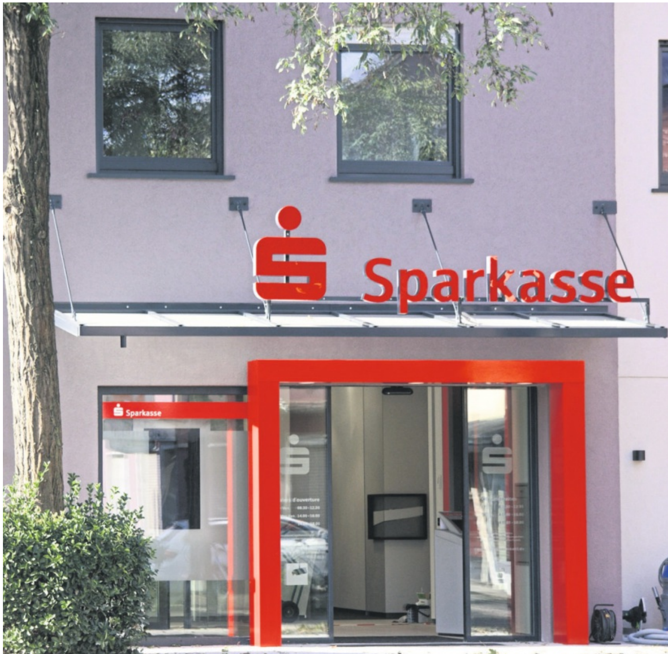
Schon von weitem ist der Eingangsbereich von außen gut zu erkennen – die Sparkasse zeigt mit der Gestaltung des Außenbereichs der Filiale Flagge in Lichtenau.