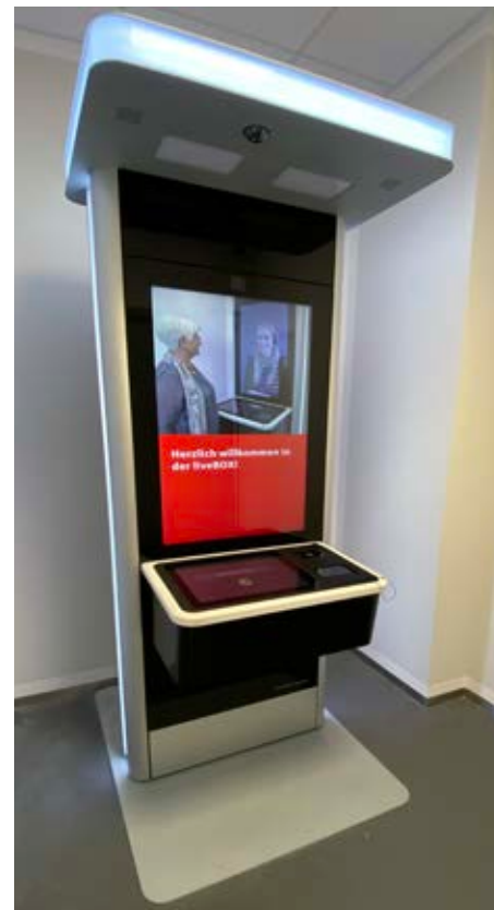
▲ Die LiveBox: digitale Serviceberatung vor Ort bei der Sparkasse Bodensee

Dieses individuelle Bespielen des Standortes fordert die Mitarbeiter und bedingt qualitative Unterstützung. Dazu muss der Standort aber nicht täglich mit allen Mitarbeitern besetzt sein, gefragt sind vielmehr flexible Nutzungskonzepte. Autonome Lösungen wie digitale Serviceberatungsmodule sind sicher temporär und unter bestimmten regionalen Bedingungen sinnvolle Angebote, die aber das Potenzial der Filiale als Immobilienobjekt nicht ausschöpfen können. Hier eröffnen sich durch die aktuelle Situation und deren längerfristige Auswirkungen auf die Arbeitswelt neue Chancen für die Präsenz vor Ort.