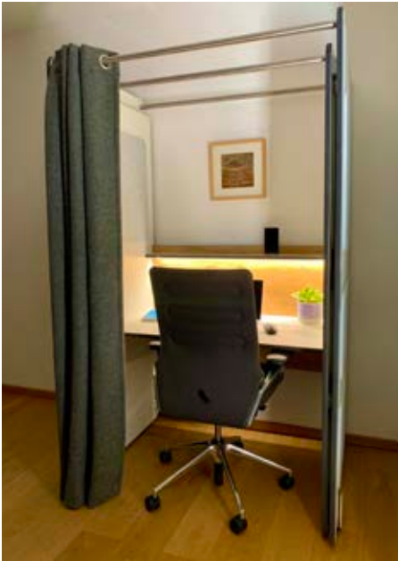
▲ Die „Arbeitslaube“: Das Homeoffice als cooler Ort für mobiles und flexibles Arbeiten