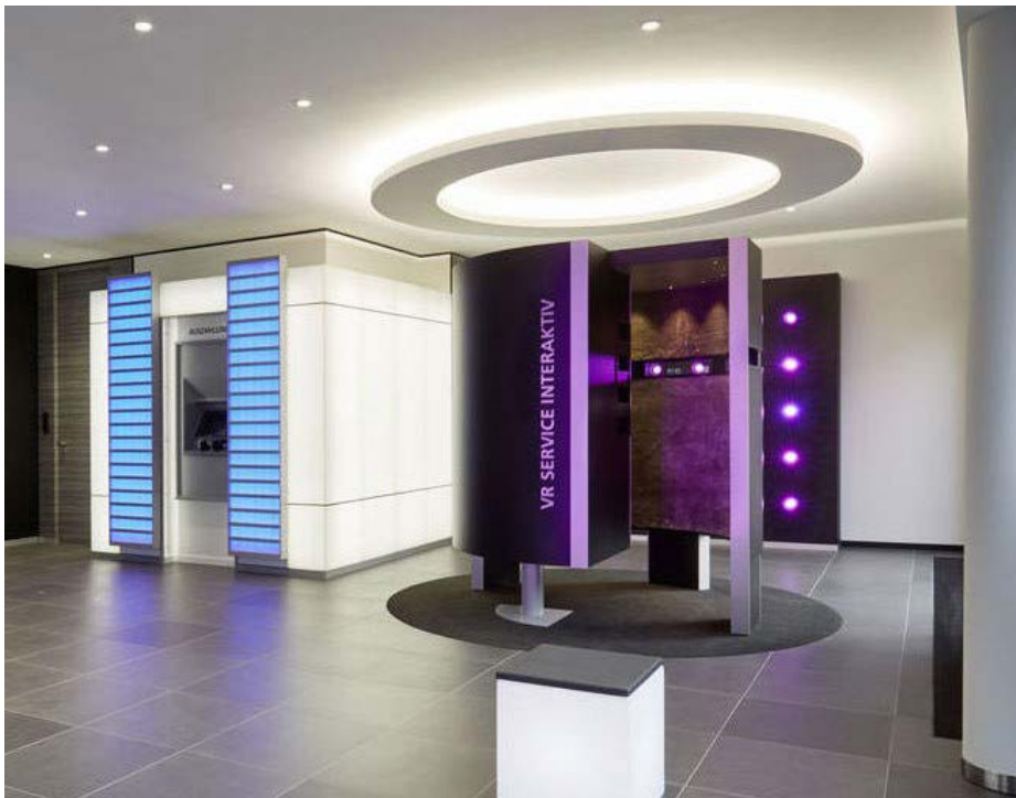
▲ Auf dem Weg in die digitale Zukunft: Persönliche Präsenz wird digital neu interpretiert

Kundenorientierung ist ein viel gebrauchtes Schlagwort – doch was heißt das eigentlich für die Gestaltung von Bankfilialen in Zeiten fortschreitender Digitalisierung?