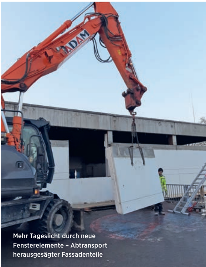
Mehr Tageslicht durch neue Fensterelemente – Abtransport herausgesägter Fassadenteile