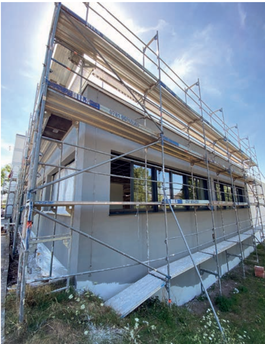
Werthaltige Dämmung der Außenwände mit einem Wärmedämmverbundsystem

Die energetische Ertüchtigung des Gebäudebestands ist die Voraussetzung für einen ökologischen, nachhaltigen Geschäftsbetrieb. Jenseits von Klimaschutzaspekten können energetische Sanierungsmaßnahmen aber auch wirtschaftliche Vorteile bringen und die