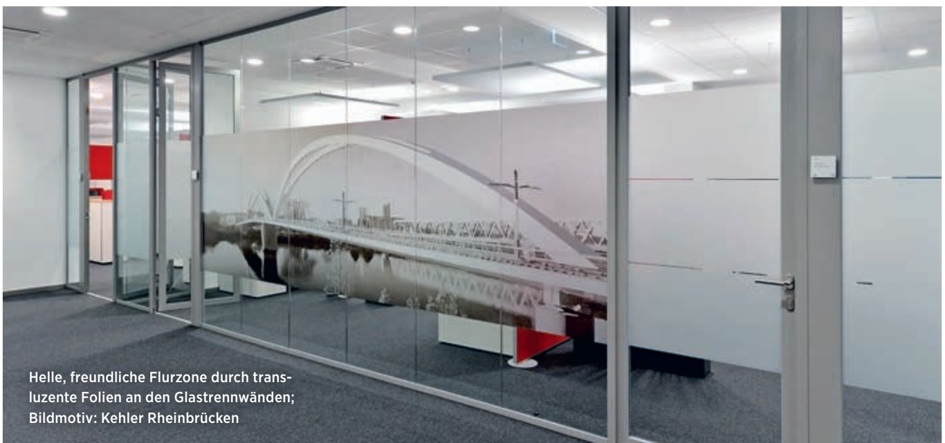
Helle, freundliche Flurzone durch transluzente Folien an den Glastrennwänden; Bildmotiv: Kehler Rheinbrücken

zieren – und das ohne Abstriche bei der Beleuchtungsstärke im Raum. Dimmbare LED-Leuchten, kombiniert mit raumbezogenen Sensoren für Tageslicht- und/oder Präsenzsteuerung, reduzieren die Energiekosten zusätzlich. Mit einer Lebensdauer von über 50.000 Stunden ergeben sich durch den Einsatz von LED-Leuchten auch Einsparungen bei der Wartung. Veraltete Beleuchtungssysteme lassen sich