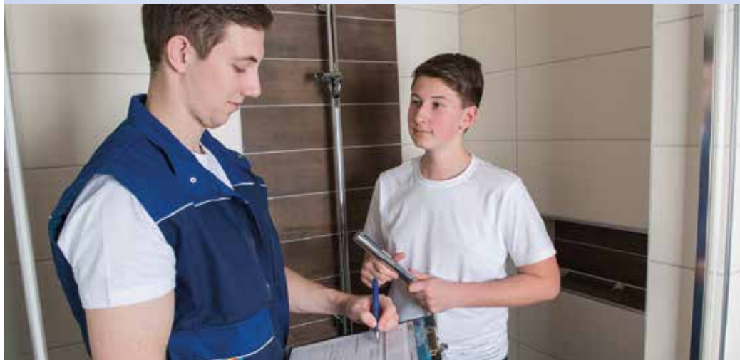
Passt der Beruf zu mir? Jugendliche sollten ein Schülerpraktikum nutzen, um die spannende Welt des Sanitär-, Heizungs- und Klimahandwerks kennenzulernen.

Wer Interesse hat, findet auf der Website nicht nur SHK-Betriebe in seiner Nähe, sondern auch hilfreiche Bewerbungstipps, die für die Ausbildungsplatzsuche nützlich sind.