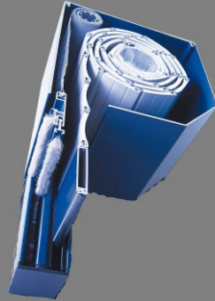
Auch mit integrierten Insekten- oder Sonnenschutz herstellbar

Die Kästen, Führungsschienen und Endleisten sind in den Standardfarben weiss 19 dunkelbraun 22, anthrazitgrau 53 oder silber 20 erhältlich. Gegen Aufpreis beschichten wir diese aber auch in allen standard RAL- Farben.