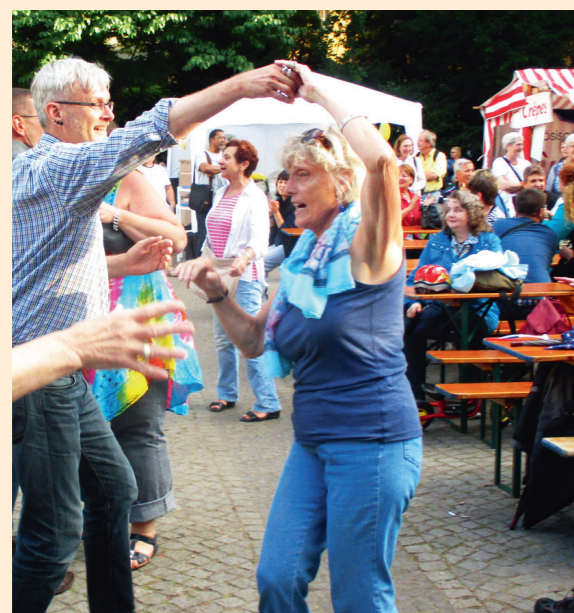
RÜDI-NET SOMMERFEST AM 25./26. AUGUST

Ausführliche Informationen finden Sie unter www.ruedi-net.net