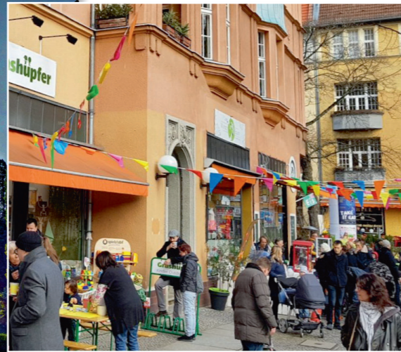
Osteraktion im März 2018