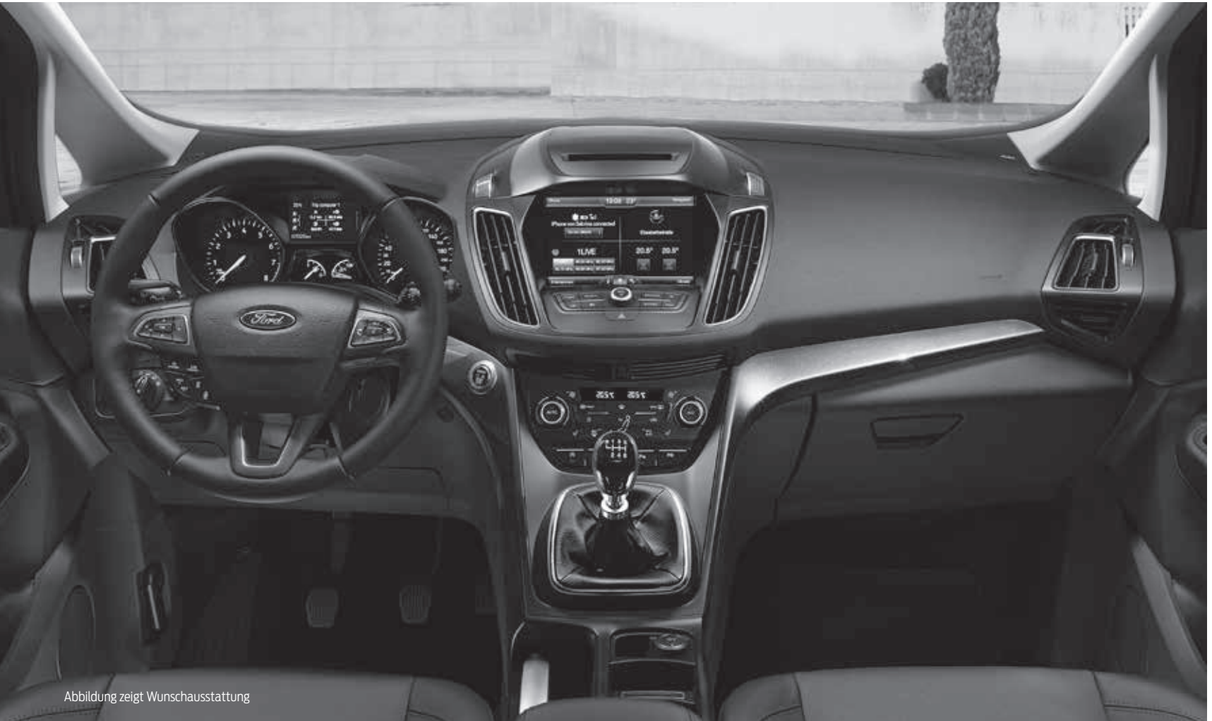
Abbildung zeigt Wunschausstattung