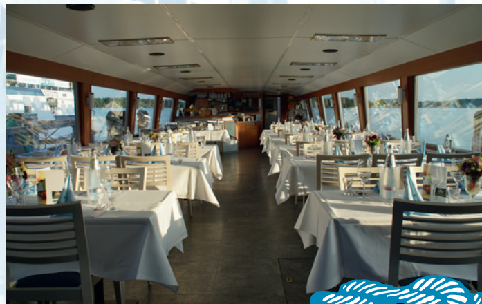
Beispiel: Dekorationspauschale buchbar