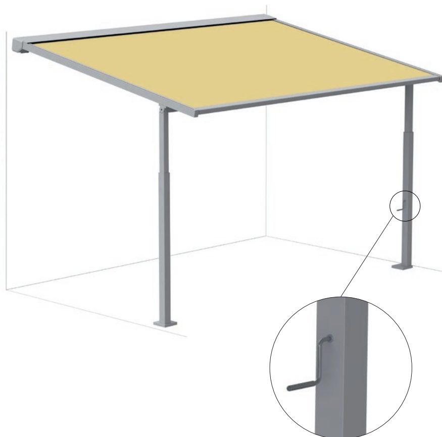
Optional absenkbare Säule