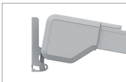
Kastendesign ELEGANZA 253 mm x 156 mm