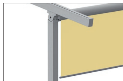
Optional Varioplus-Rollo (motorbetrieben)