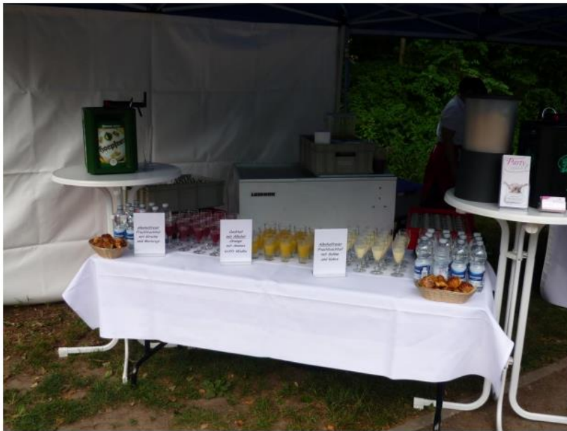
Cocktailempfang mit Bier, Sekt und Orangensaft – alles frisch gezapft.