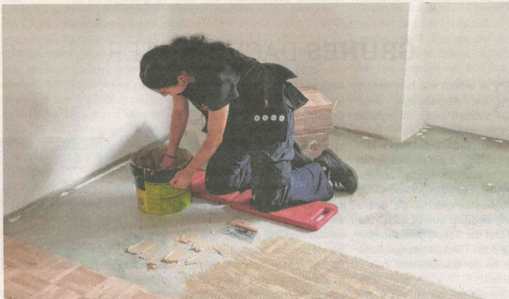
Trockenbau- und Parkettlegearbeiten zählen ebenfalls zu den Tätigkeitsbereichen der angehenden Zimmerin.