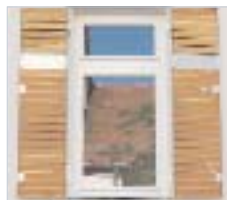
Stahlrahmen mit Douglasie