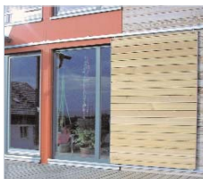
Stahlrahmen mit Lärchelattung

Die Möglichkeit, Läden aus verschiedenen Materialien in nahezu beliebiger Kombination herzustellen, machen Fensterläden zu einem spannenden Bauteil. Einige Beispiele sehen Sie auf den Photos.