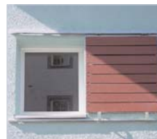
Stahlrahmen mit PVC-Platte