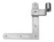
Beschläge je nach Ausführung und Anforderung