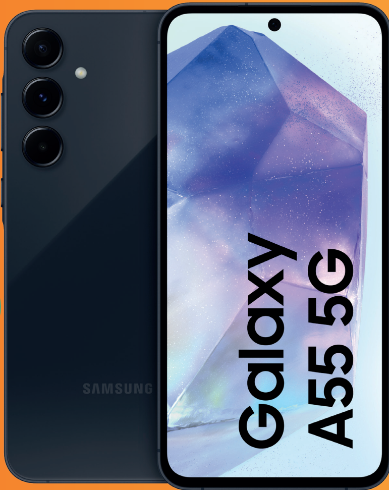
SAMSUNG Galaxy A55 5G (128 GB)

30 GB DATEN- VOLUMEN IM TARIF ALLNET FLAT CLASSIC OHNE ANSCHLUSSPREIS FÜR MTL.