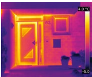
Vor der Sanierung – rote Farbe zeigt einen hohen Energieverlust

Beim Einbruchschutz erfüllt das Türsystem heroal D 72 die Anforderungen der Widerstandsklasse RC 3 – das ist die Kategorie, die von der Polizei für höherwertigen Hausrat und ein höheres Sicherheitsbedürfnis empfohlen wird. Das Türsystem gibt es auch in speziellen Ausführungen als Flucht- und Rettungsweg nach DIN 179/1125 (mit CE Kennzeichnung) sowie als Fingerschutztür und komplett barrierefrei – sicher ist sicher.