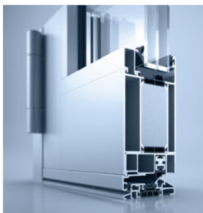
heroal D 72