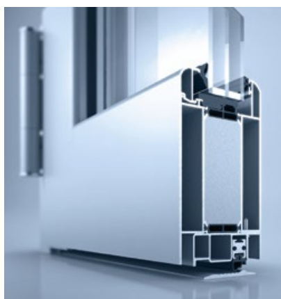
heroal D 72 RL