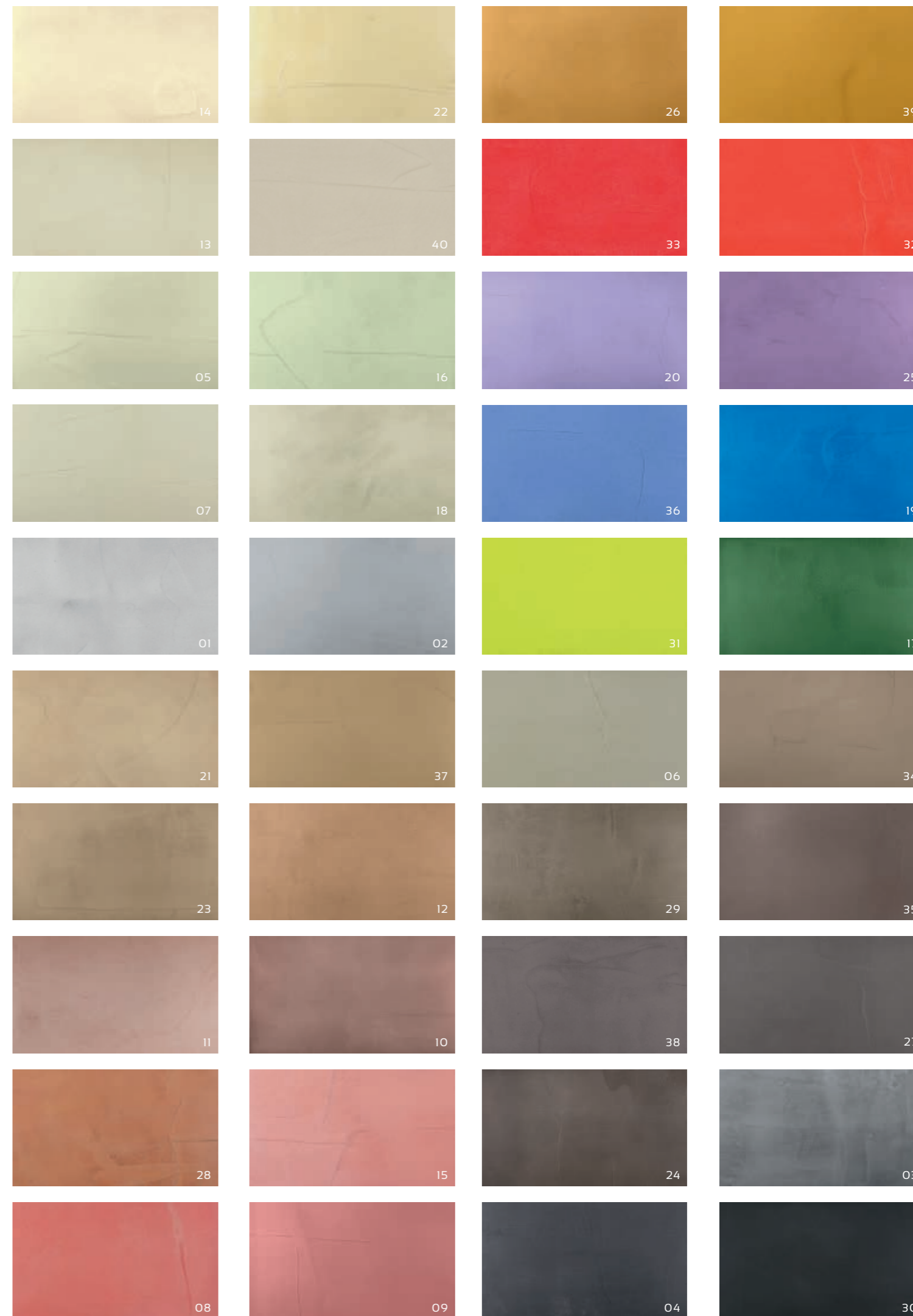
Das Farbmuster 00 (weiß) ist ebenfalls erhältlich