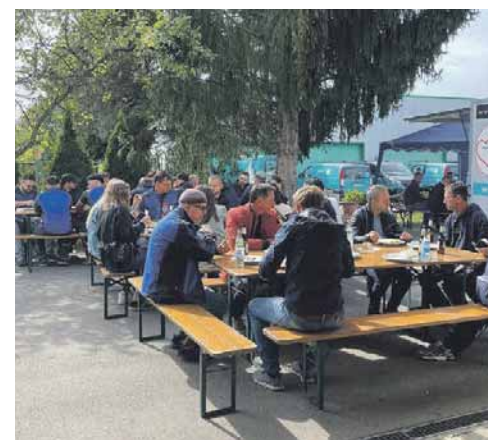
Gemeinsame Ausflüge und Grillfeste mit den Mitarbeitern gehören bei der Fendt Haustechnik GmbH dazu. Das sorgt für ein gutes Arbeitsklima.