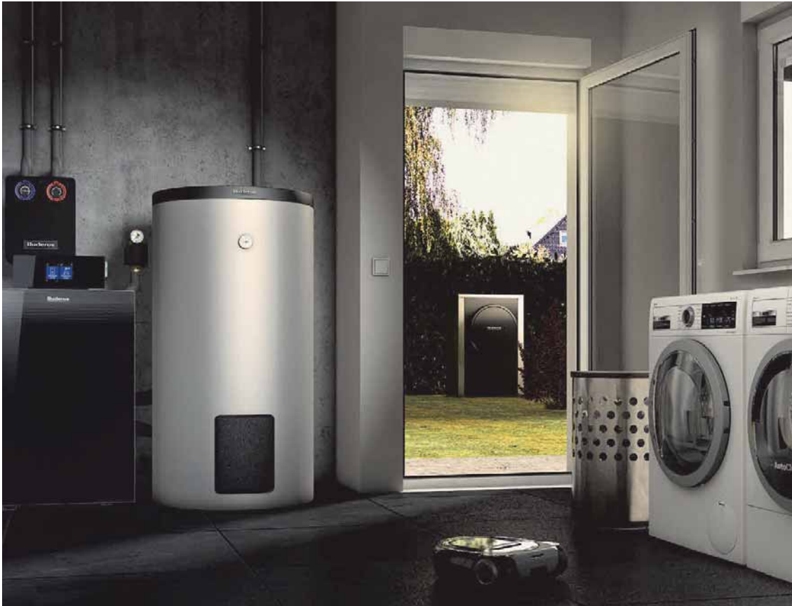
Hybride Heizsysteme können eine gute Lösung sein.