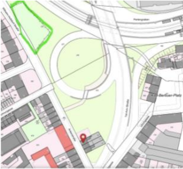
Grüne Fläche Spielplatz Perlengraben