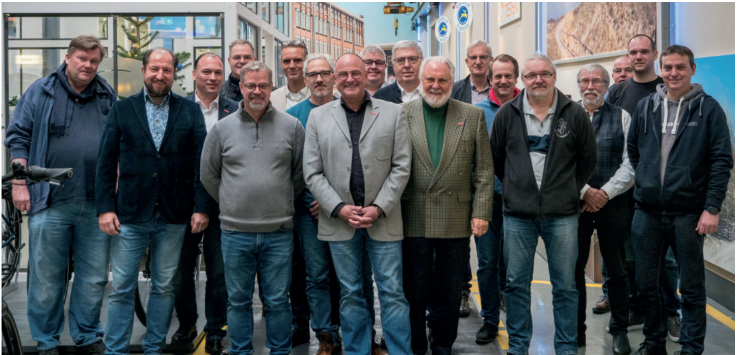
Teilnehmer der LIV-Mitgliederversammlung 2022

Am 7. Dezember trafen sich die Delegierten des Landesinnungsverbandes Zweirad-Handwerk NRW zu ihrer Jahresversammlung in der Deutschlandzentrale des traditionsreichen niederländischen Fahrradherstellers Gazelle in Mönchengladbach.