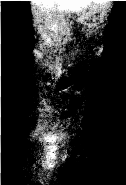
Abb. 1: Charakteristisches Ulcus cruris mit Varikosis, Venektasien, Purpura jaune d'ocre, Atrophie blanche, Dermatosklerose und Stauungsdermatitis

Ein typisches Krankheitsbild zeigt die Abb. 1. Charakteristisch sind Varikosis, Venektasien, Besenreiser, Purpura jaune d'ocre, Atrophie blanche, Dermatosklerose und Stauungsdermatitis. Bei der Purpura jaune d'ocre handelt es sich um Hämosiderinablagerungen, die durch venöse Stase bedingt sind. Häufig besteht Schuppung in unterschiedlicher Ausprägung. Ausgelöst wird die venöse Stauung bei Bindegewebschwäche durch Insuffizienz von