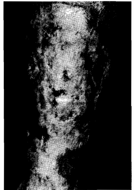
Abb. 4: Ulcus cruris nach Transplantation

Auch blasenbildende Hauterkrankungen können zur Ulzeration führen. Bei bullösem Pemphigoid wie auch bei Pemphigus vulgaris entstehen nach Eröffnung der Blasen schlecht heilende Erosionen und Ulzerationen. Da am übrigen Integument meist Blasen erkennbar sind und sich bei tangential mechanischem Druck die Haut abschieben läßt (Nikolski-Phänomen), ist die Vermutungsdiagnose einer blasenbildenden Hauterkrankung im allgemeinen leicht zu stellen.