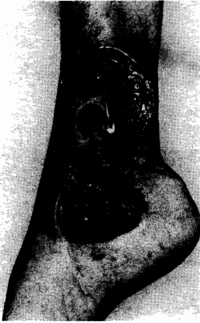
Abb. 2: Ulcus cruris auf dem Boden einer arteriellen Verschußkrankheit

gramm, Oszillographie, gegebenenfalls durch Angiographie sowie durch die anamnestische Angabe von Claudicatio-Beschwerden.