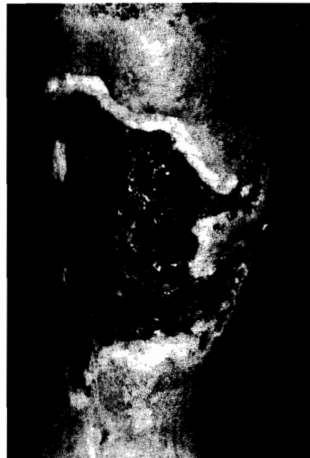
Abb. 3: Ulcus cruris nach Vorbehandlung vor Transplantation

Typisches Aussehen haben Ulzera, die auf dem Boden einer Vasculitis allergica entstehen. Sie sind oft polyzyklisch begrenzt und besitzen einen hochroten, livide getönten Rand, oft mit hämor-