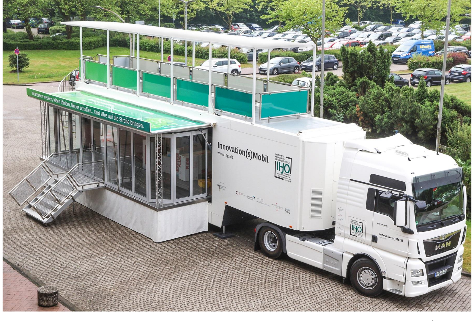
Das Innovation(s)Mobil der Innovativen Hochschule Jade-Oldenburg!

Präsentation des Projekts im Science Truck der Innovativen Hochschule Jade-Oldenburg am 08. und 09.07.2022 in Oldenburg