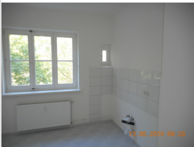
Küche - Beispiel

Zimmer: 1,50 Wohnfläche ca.: 48,20 m 2 Kaltmiete: 374,03 EUR (zzgl. Nebenkosten) Gesamtmiete: 524,03 EUR