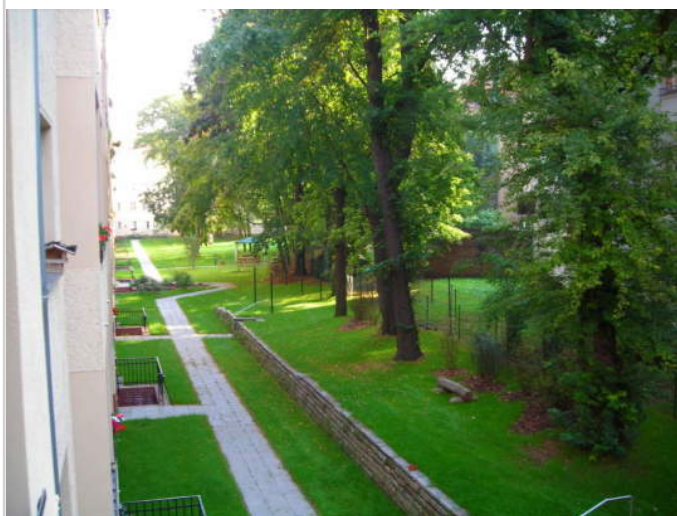
Innenhof / Rückseite