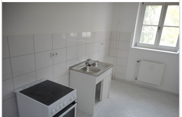
Küche - Beispiel