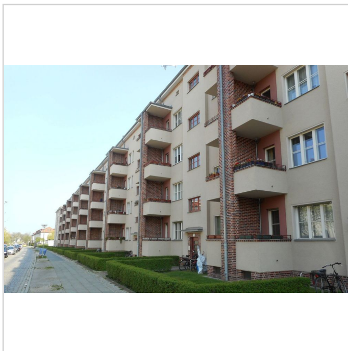
Straßenseite / Hauseingänge

Das Ausstellen von Energieausweisen ist daher hier NICHT erforderlich (Ausnahmeregelung).