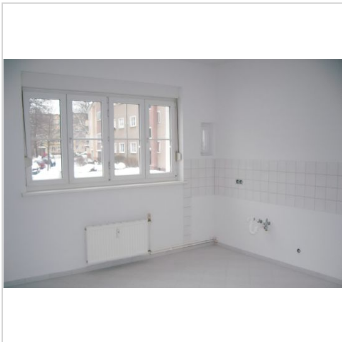
Küche - Beispiel