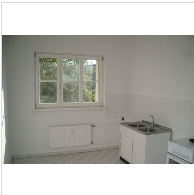
Küche - Beispiel