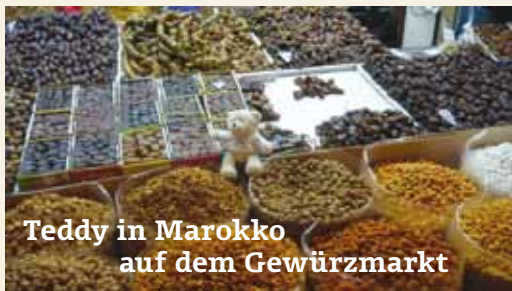
Teddy in Marokko auf dem Gewürzmarkt

Prenzlauer Promenade 128, 13189 Berlin Mo., Di., Do., Fr., 08:00 Uhr – 12:00 Uhr Mittwoch 15:00 Uhr – 18:00 Uhr