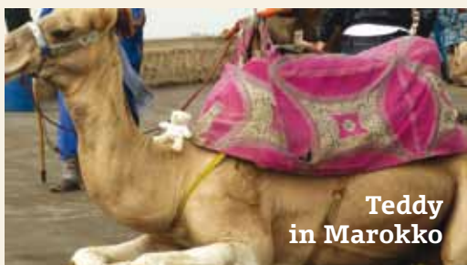
Teddy in Marokko