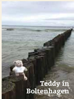
Teddy in Boltenhagen