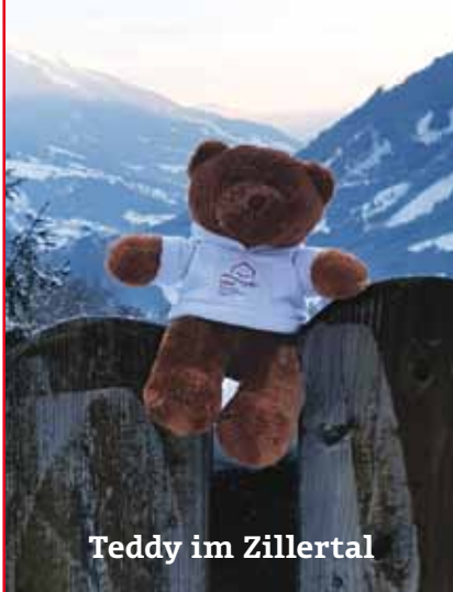
Teddy im Zillertal