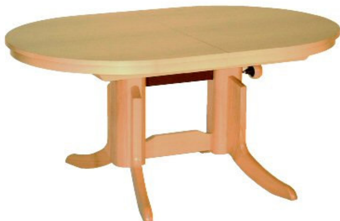
Gestell CW 08