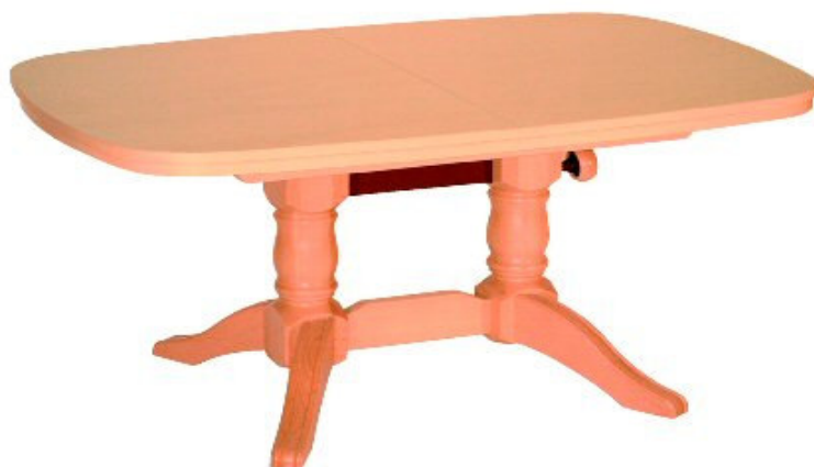
Gestell CW 07