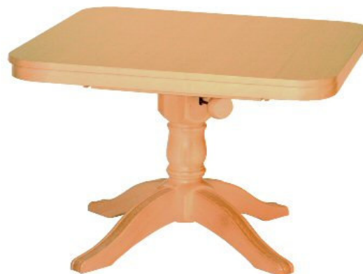
Gestell CG 07

(Gestellfußübersicht Seite 2 Programm Couchtische)