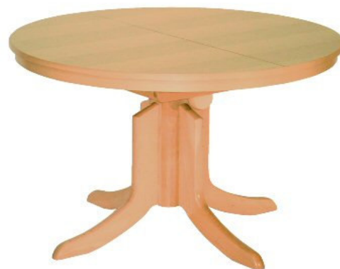
Gestell CG 08

Tisch MELAMY Modellreihe NEUSTADT Modell CE/COE/CBOE Gestellfußtisch rund/oval Platte Melaminharz, 38 mm Optik Standardauszug Höhenverstellbar mit Gashublif Zargenrahmen Melaminharz 19 mm stark Gestellfuß wählbar, Grundholz Buche, gebeizt (Gestellfußübersicht Seite 2 Programm Couchtische)